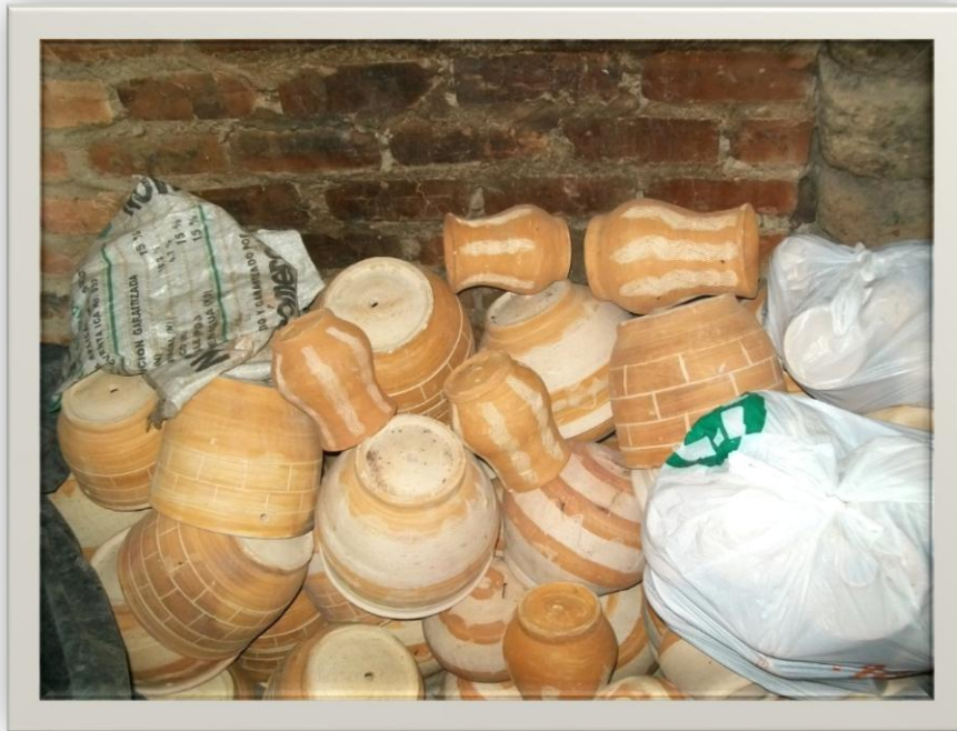
Ilustración 12.