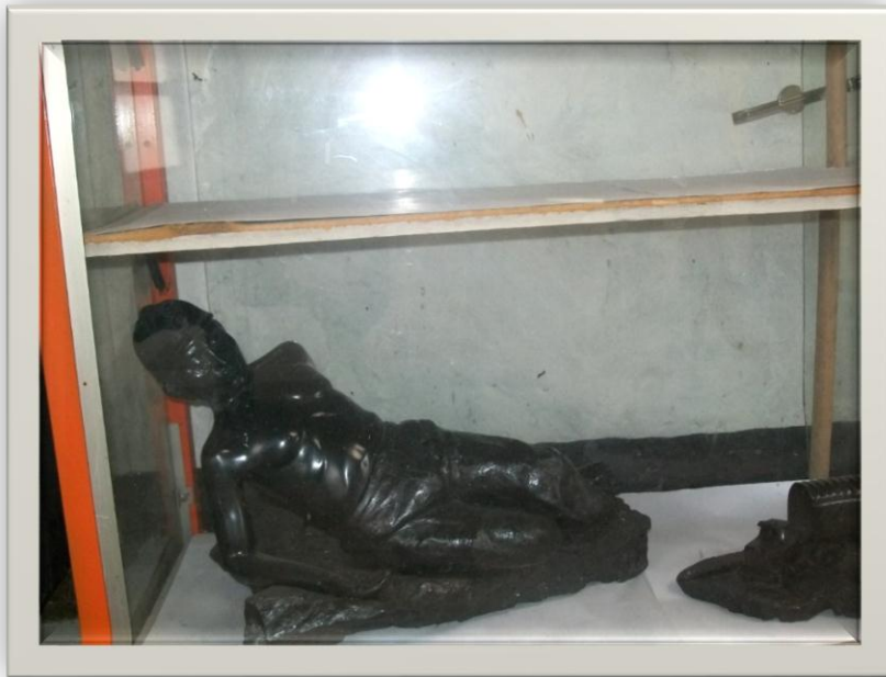
Ilustración 10. Fuente de Autor