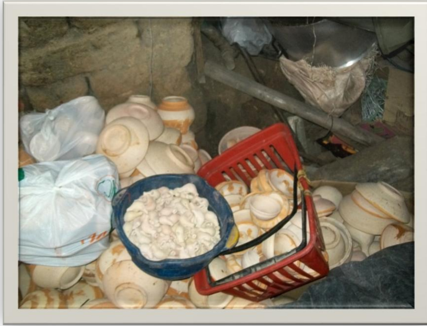
Ilustración 13.