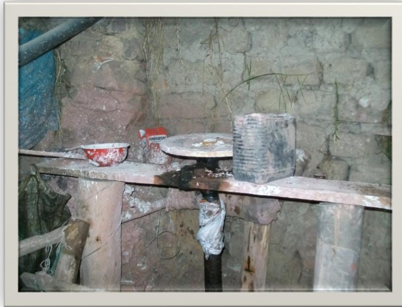
Ilustración 11.