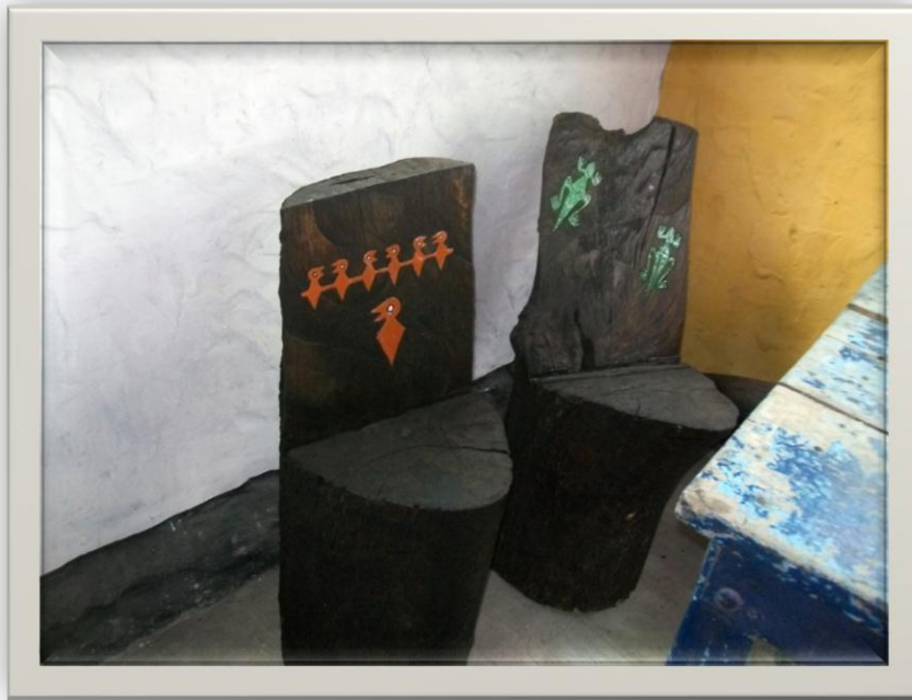
Ilustración 7.