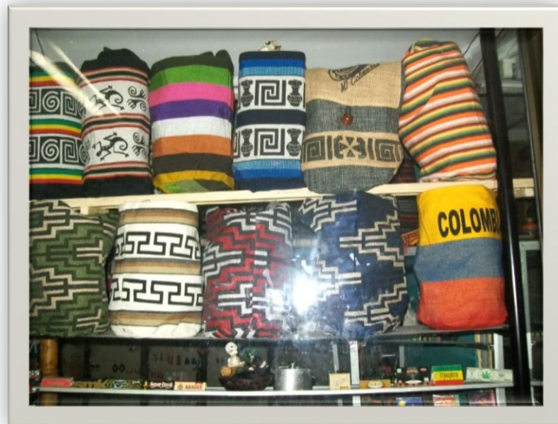
Ilustración 2.