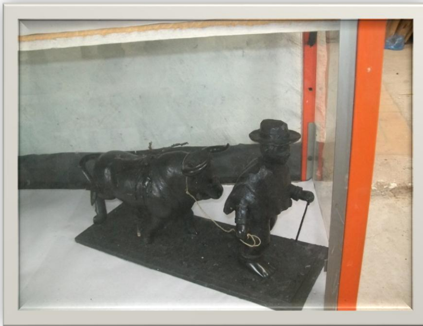
Ilustración 8.