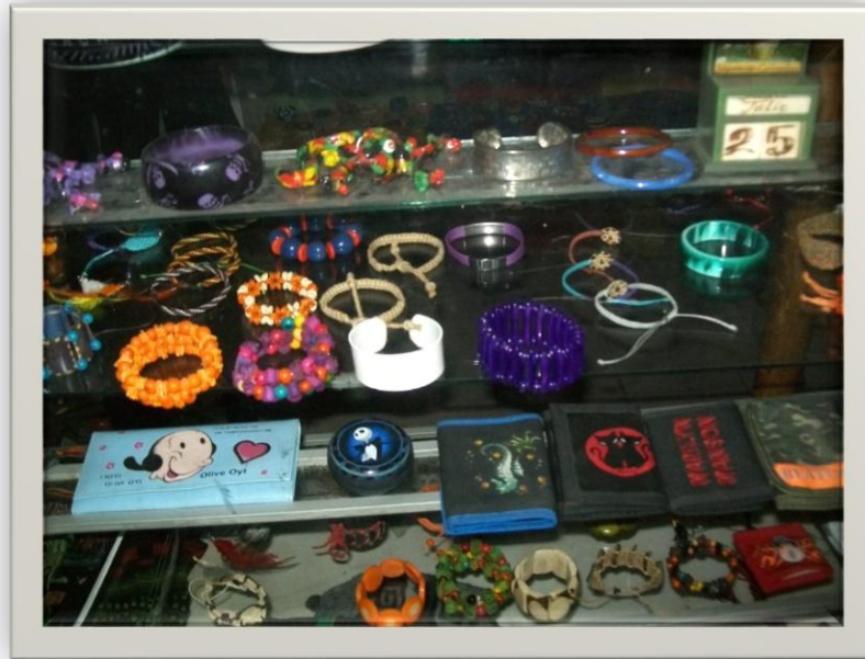
Ilustración 1.