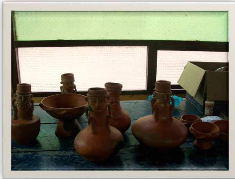
Ilustración 6.