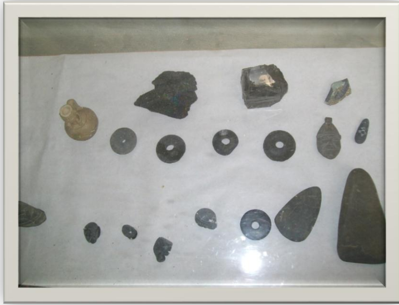
Ilustración 9.