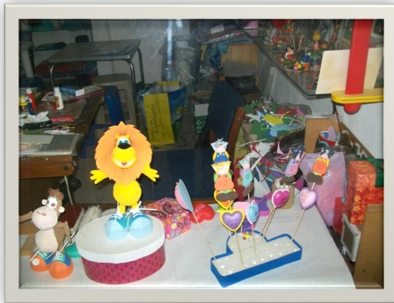
Ilustración 4.