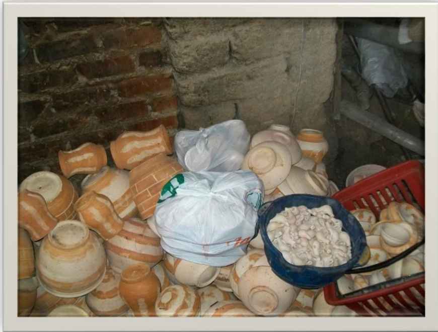
Ilustración 14. Fuente de Autor