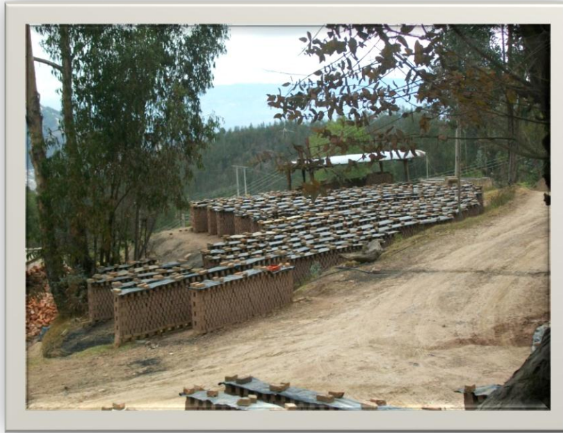
Ilustración 5. Fuente de Autor