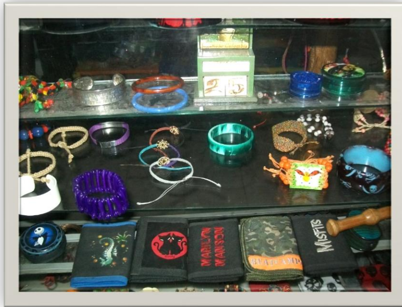
Ilustración 3.