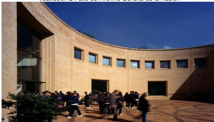
Ilustración 2 Patio del Archivo General de la Nación