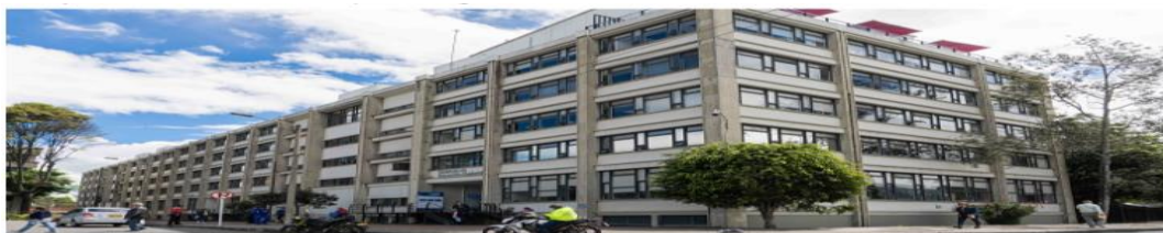
Ilustración 1. Ministerio de Educación Nacional de Colombia