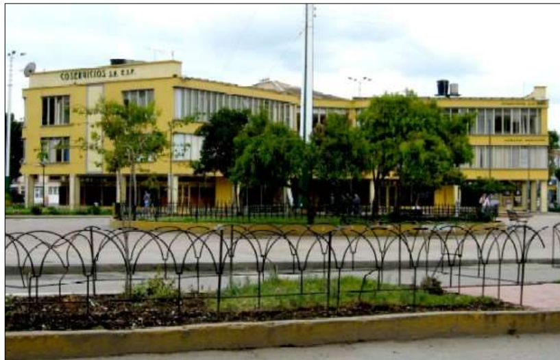
Ilustración 2. Instalaciones físicas de la Alcaldía de Sogamoso.

Sede de administración: Edificio Administrativo Plaza 6 de septiembre (Sogamoso, Boyacá).