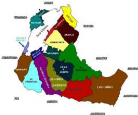
Ilustración 1. Mapa del municipio de Sogamoso.

Municipio de Sogamoso: El trabajo se realizará en el municipio de Sogamoso, ciudad colombiana situada en el centro-oriental del departamento de Boyacá, a 228,5 km al noreste de Bogotá, la capital del país y a 75,8 Km de Tunja la capital del departamento. Es la capital y ciudad principal de la Provincia de Sugamuxi en la región del Alto Chicamocha localizándose a 2.569 m de altitud sobre el nivel del mar con temperaturas promedio de 18 °C.