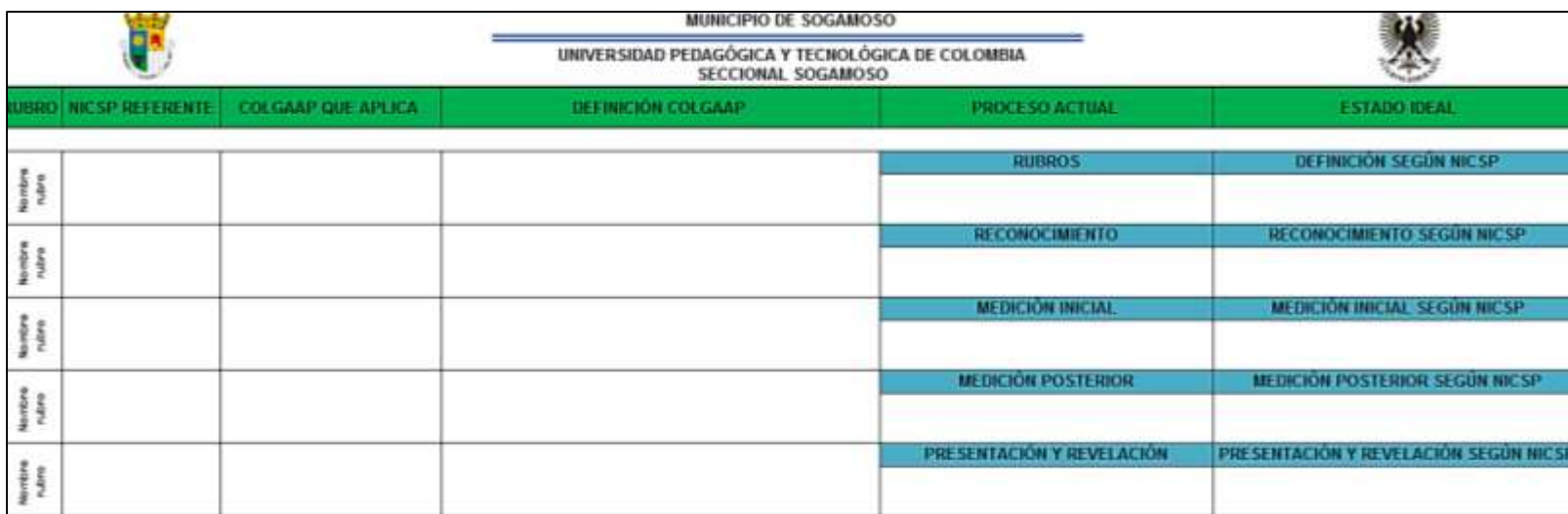
Ilustración 4. Diseño Matriz Diagnóstico de la Alcaldía de Sogamoso 2015.