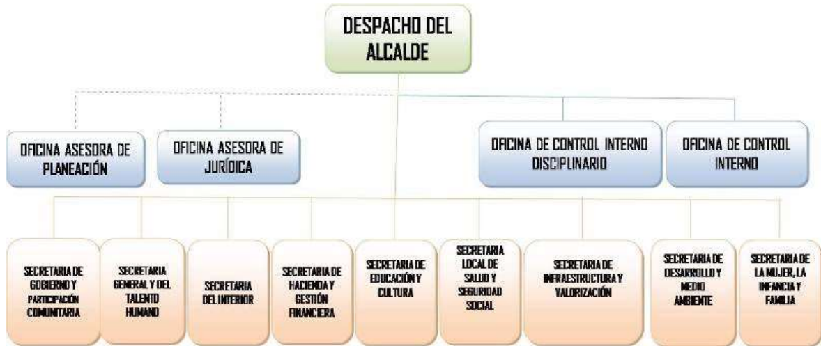
Ilustración 3. Organigrama Alcaldía de Sogamoso.