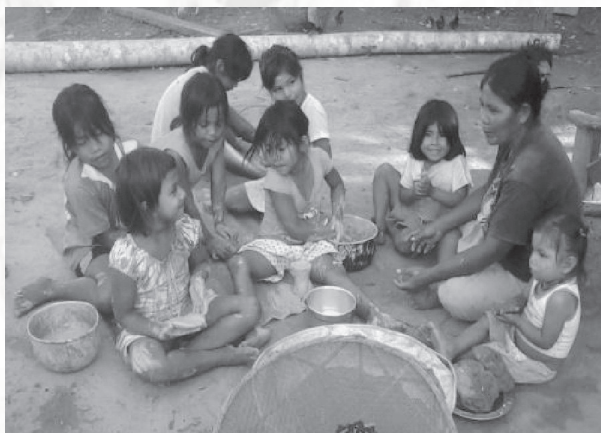
Figura 2. Los niños de los centros educativos con los sabedores de la comunidad, estrategia pedagógica desarrollada por los estudiantes de la licenciatura

Las riquezas de estos pueblos indígenas, en primer lugar, son los recursos naturales, ya que el Departamento del Guainía cuenta con un clima tropical húmedo apto para la agricultura, con productos como el plátano, la piña y la yuca con esta última se elaboran el mañoco 12 , el casabe 13 , la yucuta 14 , elmingao 15 y el pisillo 16 , y las diferentes especies de peces, que son la base del sustento de las familias indígenas, en segundo lugar, su valioso patrimonio material, inmaterial y natural; ya que estas etnias cuentan con un patrimonio material, en el que se destacan utensilios tanto de uso cotidiano como ritual, viviendas, entre otros; un patrimonio Inmaterial, conformado por manifestaciones propias de la cultura en la que se incluye la cosmovisión, historias, leyendas, tradiciones, canciones, danzas etc.; por último el patrimonio natural con diversas plantas, animales bosques, montañas, lagunas y ríos y todo lo que forma parte de la naturaleza, es así como en la región existe una gran diversidad de flora y fauna, que a lo largo del bajo Río Guaviare los convierte en un pueblo con excepcionales valores patrimoniales (Pardo y Rodríguez, 2015)