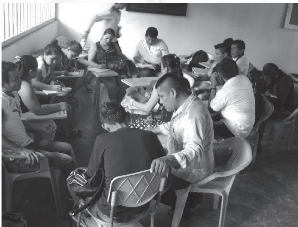
Figura 3. Encuentro junio 2016. Barrancminas-Guainía

tutorial de Barrancminas, se hacen a través de dos (2) encuentros presenciales por año, así mismo de tutorías virtuales con la ayuda de algunas herramientas tecnológicas de información a las cuales los estudiantes pueden acceder con el propósito de estar en contacto con sus docentes y compañeros permitiendo la construcción de referentes pedagógicos tanto desde la propia cultura, como desde la consulta y exploración de autores externos. Igualmente, se plantean propuestas de trabajo lideradas por la docente coordinadora del Centro tutorial, relacionadas con el contexto cultural que los estudiantes manejan durante su vida laboral. Vale la pena mencionar algunas de ellas: