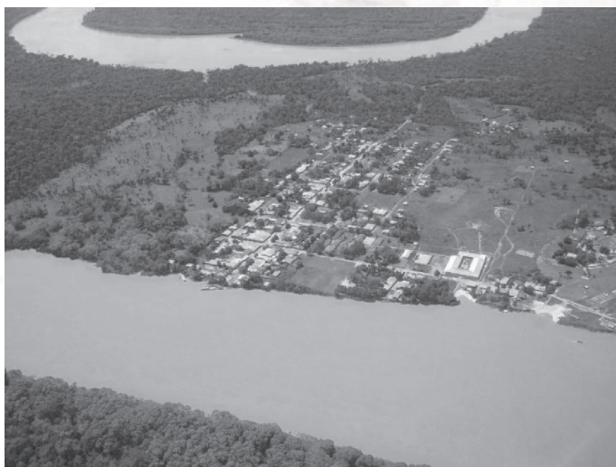
Figura 1. Vista Aérea. Corregimiento de Barrancominas-Guainía

Para desplazarse desde Tunja a Barrancominas, se requiere un recorrido que incluye un viaje por tierra hasta Villavicencio y una jornada de aproximadamente tres horas en un avión carguero, que sobrevuela y atraviesa los llanos orientales, para luego adentrarse en el corazón de la selva del Orinoco Colombiano en el que se visualiza el largo y majestuoso río Guaviare de la Orinoquia colombiana, de aguas doradas que recorren de oriente a occidente; tiene 1.497 km de longitud, habitan los Guayabero, los Tinigua, los Sikuni, los Nukak, los Piapoco y los Puinave. (Didácticas del Río Guaviare, 2015), esta hermosa tierra rodeada de un sin número de animales, árboles y plantas exóticas desde épocas inmemoriales se encuentra habitada por la comunidad indígena Piapoco y Sikuni, que hace parte de la familia lingüística Arawak y Guahibo, Curripaco y Yeral, que conforman todo un complejo cultural en territorios tradicionales de los ríos Guaviare, Guainía, Inírida y río Negro Brasil. La siguiente es una imagen área donde se puede observar algunos asentamientos a las orillas del Río Guaviare.