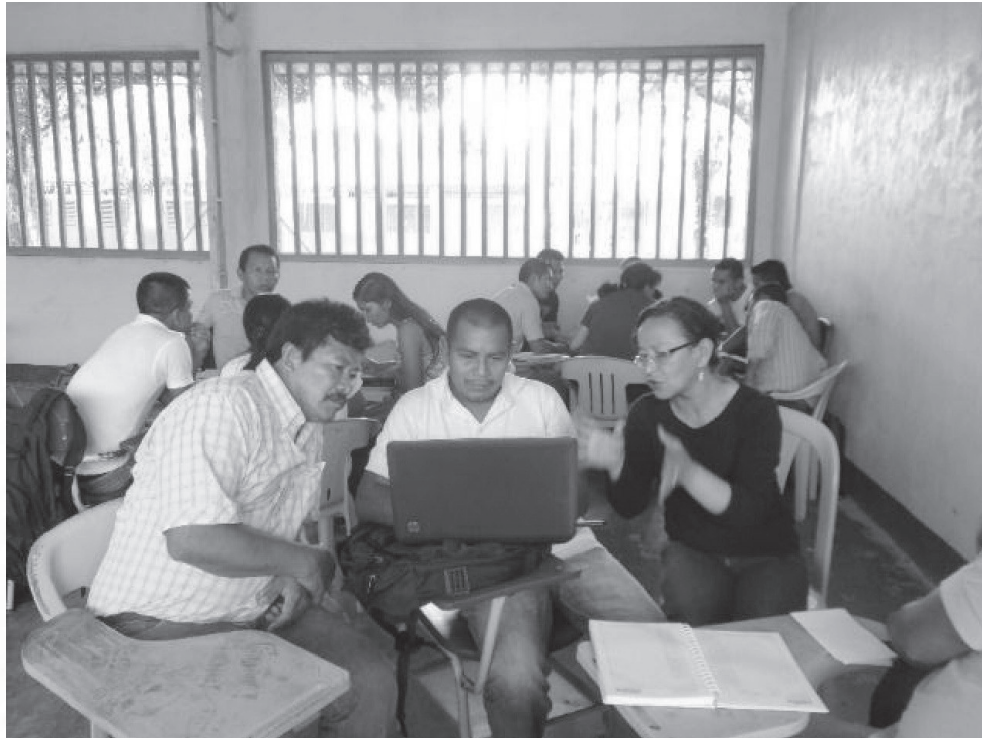
Figura 4. Docente de la Licenciatura y estudiantes del centro tutorial de Barrancominas