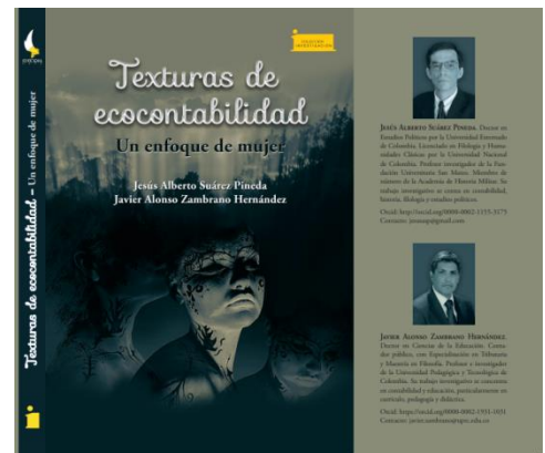
Portada del libro «Texturas de ecocontabilidad. Un enfoque de mujer»

Consulte la versión electrónica del libro aquí .