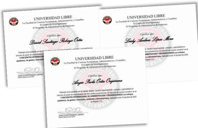
Certificados de participación de los ponentes