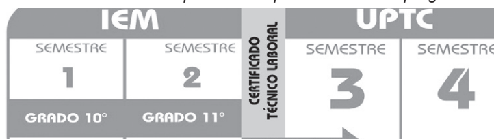
Gráfico 3. Esquema de implementación del programa de articulación.